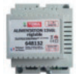
Réf. 648132 Alimentation réglable 13,5 V= 3A rail DIN