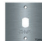
Réf. 648505 Façade inox pour lecteur T25 - 110x110 mm