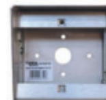
Réf. 646750 Cadre saillié pour boîtier inox 110x110 mm