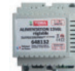
Réf. 648132 Alimentation réglable 13,5 V= 3A rail DIN